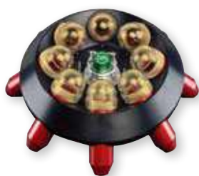
8 × 50 mL 分立式角转头