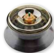
MicroClick 18 × 5 微量角转头