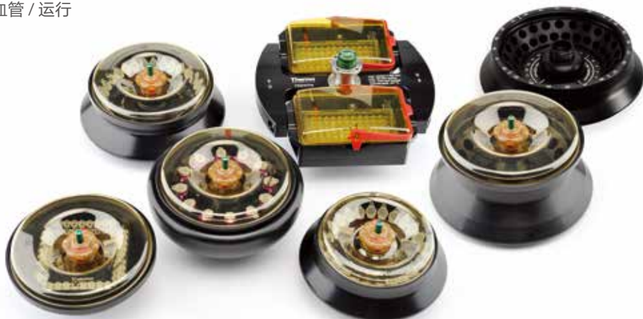
微量离心转头产品线