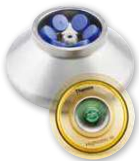
HIGHConic III 角转头