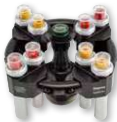
TX-100S 水平转头 带密封吊篮